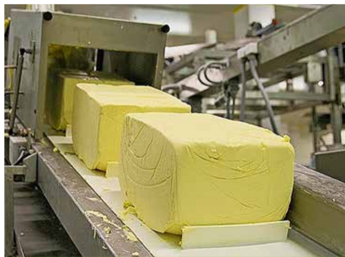
Sur les marchés mondiaux, le cours du beurre a connu une fulgurante et surprenante ascension.

Après une hausse au second semestre 2016, les cours de la poudre de lait écrémé au départ de l'Océanie sont à nouveau en recul et se situent à un faible niveau proche de 2000 dollars (1940 francs) par tonne.