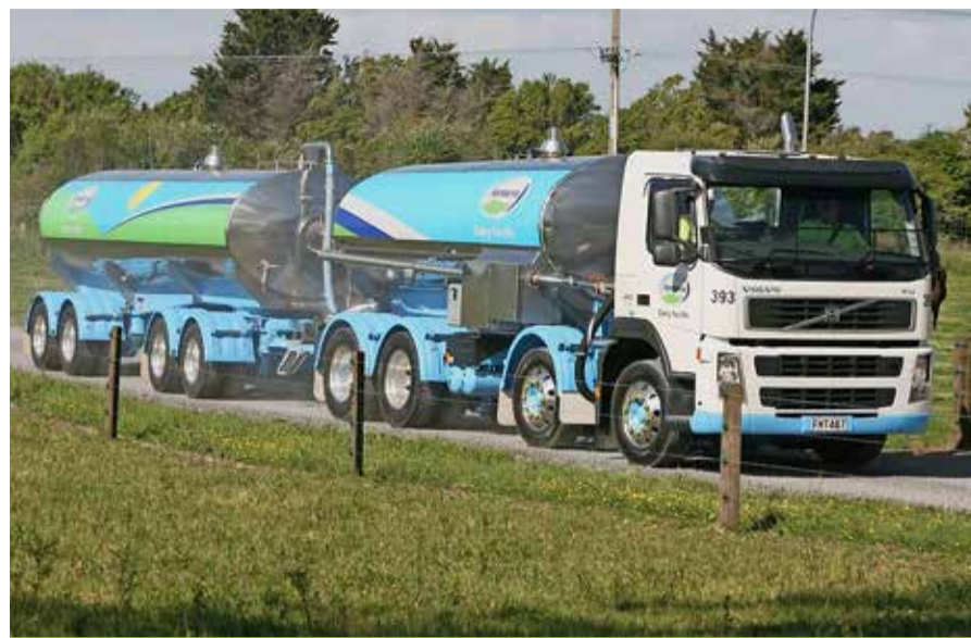
Depuis la fin de l'année dernière, le prix mondial du lait est en hausse.

Après avoir atteint des sommets en 2013 et 2014, le prix du lait sur le marché mondial s'est effondré en quelques mois. L'indice de l'IFCN (lire l'encadré ci-dessous) oscillait, de 2013 à début 2014, entre 49 et 56 dollars américains (entre 46 et 52 francs suisses de l'époque) par 100 kilos. A son plus bas niveau, au premier semestre 2016, il atteignait 22 dollars (22 francs suisses) par 100 kilos. Depuis, un net redressement des cours s'est opéré. Au mois de juin 2017,